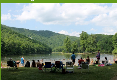
Parte baja del Lago Sherando