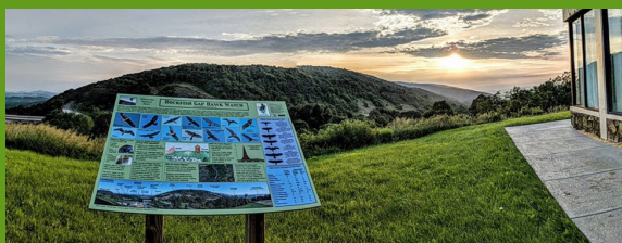
Vista desde la montaña Afton